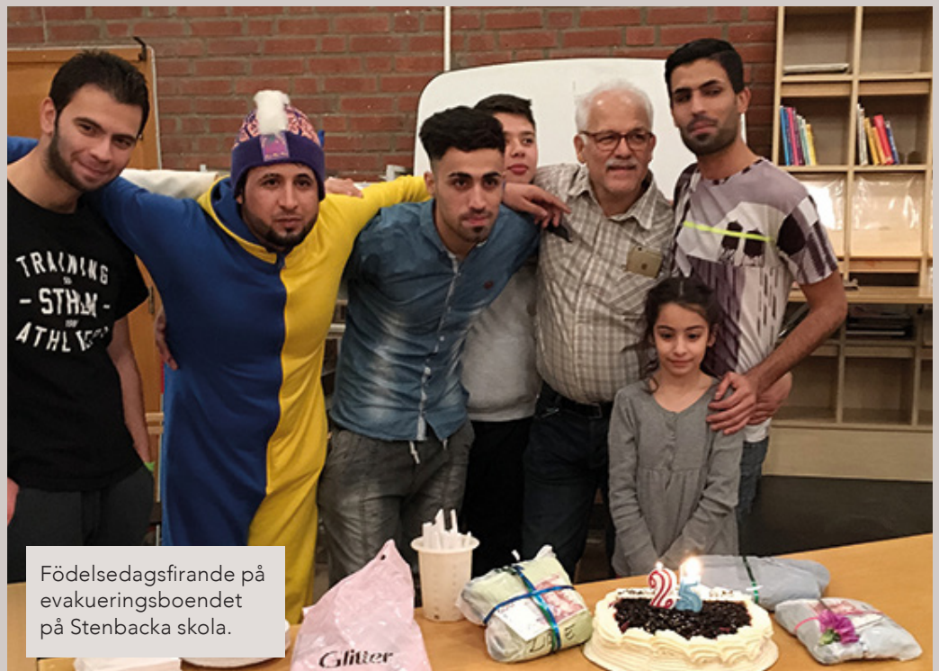
Födelsedagsfirande på evakueringsboendet på Stenbacka skola.

”Bostadsfrågan är komplicerad eftersom det saknas bostäder generellt. Men kommunen jobbar för högtryck med att hitta såväl tillfälliga och som permanenta lösningar.”